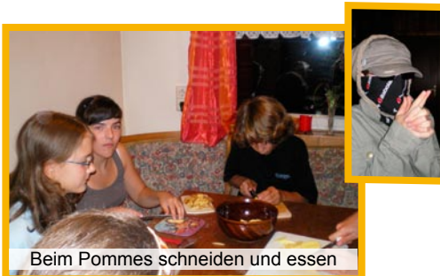
Beim Pommes schneiden und essen