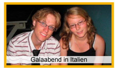
Galaabend in Italien