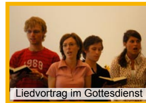
Liedvortrag im Gottesdienst