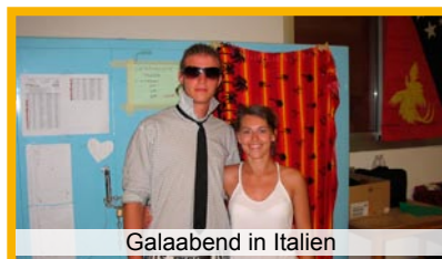
Galaabend in Italien