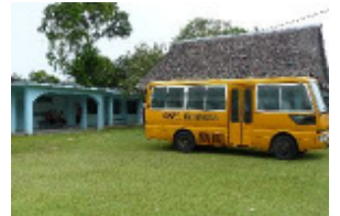
Den Namen unseres Infobriefes mussten wir glücklicherweise nicht ändern, da wir auch hier in Palau auf einem Campus Namens Emmaus untergebracht sind.