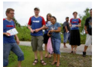
Beim Verteilen von Einladungen und Traktaten!