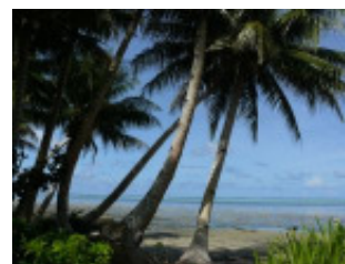
Einfach nur traumhaft!