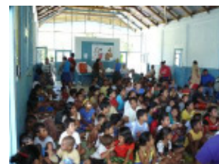
Begeisterte Kinder bei der VBS