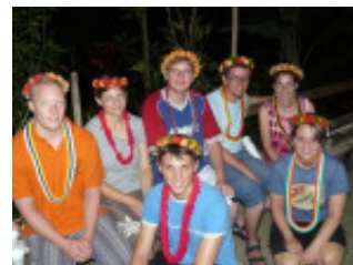
Unser Team - geschmückt mit Blumenkränzen