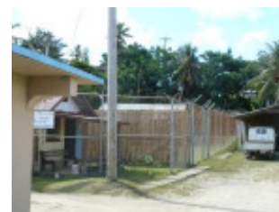
Das Gefängnis von außen