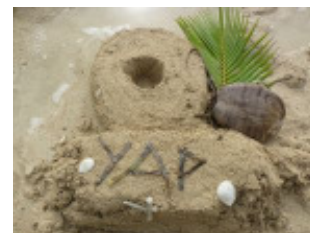
Yap the Island of Stone money!