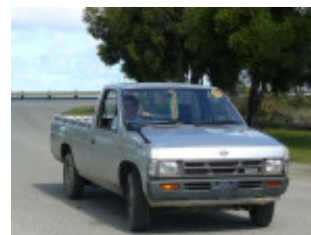
Mit diesem Auto erlebten wir auch so manches Abenteuer