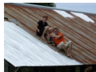
Beim Streichen auf dem Dach