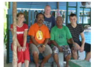
Hausbesuch in Peleliu