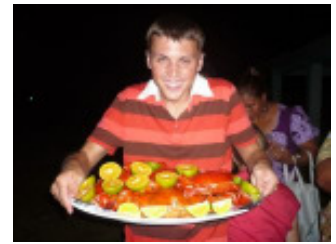
Ein Haufen Krabben bei der Abschiedsfeier!