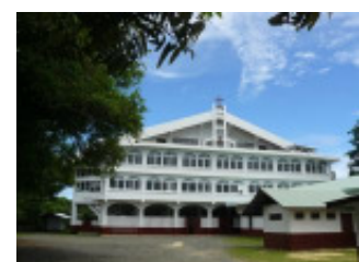
Koror Evangelical Church