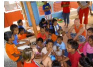
Ferienbibelschule in Airai