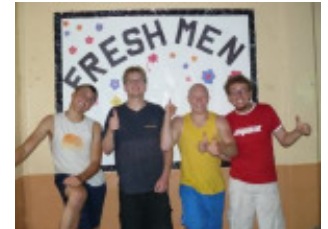
Unsere motivierten Männer!

Ein anderer Sorgenherd waren unsere Programme, die wir gestalteten. Oft mussten wir spontan Inhalte umschmeißen und umtauschen, weil der angekündigte Jugendabend sich doch als Seniorenver-