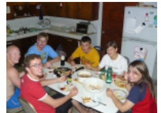
Wenn wir kochen, sieht es so aus!