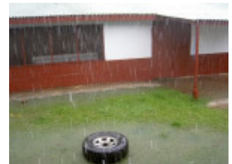
Regen, wie aus Eimern!