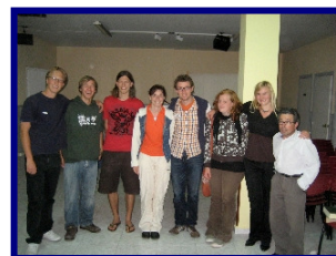
In Spanien beim 4. Besuch