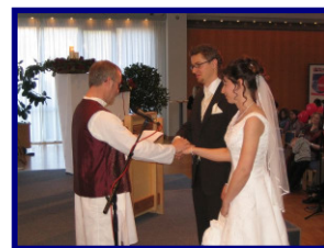
M. Auch bei der Trauung