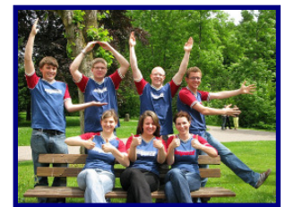
Impact Team Palau & Yap