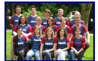
Teams Palau/Yap & Kanada auf den Vorbereitungstagen