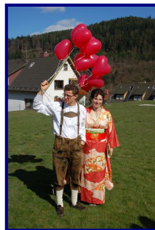
In bayrisch-japanisch Tracht beim Luftballonstart