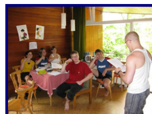
In Aktion bei den Vorbereitungstagen