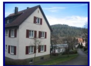
Meine neues Zuhause (3. OG)