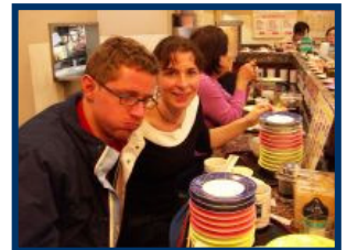
Ich sag nur Sushi... *grins