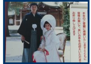
Brautmode in Japan!