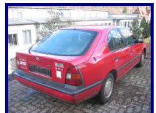
Mein alter, treuer Freund. Abgemeldet und verkauft! Schnief...